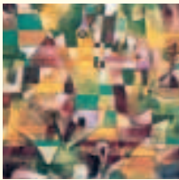
Lebensgefühl der gelben Kirchen, 1910